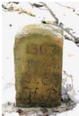
Abb. 4: Grenzstein von 1867: Gemeinde Erbstadt (GE), Königreich Preußen (KP)

An der Ostseite des Erbstädter Gemeindefeldes stehen Richtung Stammheim einige Grenzsteine aus dem Jahr 1781 (Abb. 7).