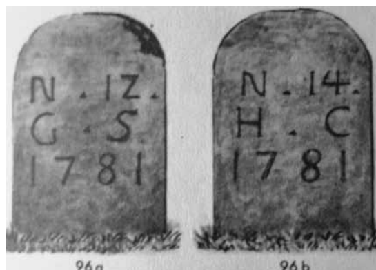
Abb. 5: Grenzstein Großherzogtum Hessen (GH)